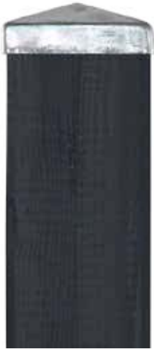
Cubic - höhe 9 cm