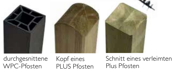
durchgeschnittene WPC-Pfosten Kopf eines PLUS Pfosten Schnitt eines verleimten Plus Pfosten

4 Nuten TxB: 12x18mm 3 Nuten TxB: 12x18mm Profilpfosten kann als unsere gemeinsame 9x9cm Pfosten verwendet werden