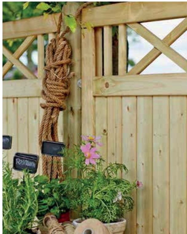
Kalmar-Elemente druckimprägniert S. 102 mit Leimholzpfosten/Beschläge S. 111-112