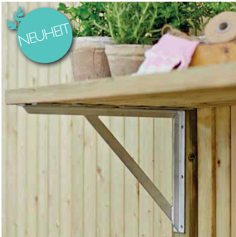
Detail: Bankbeschlag verz. Stahl S. 121