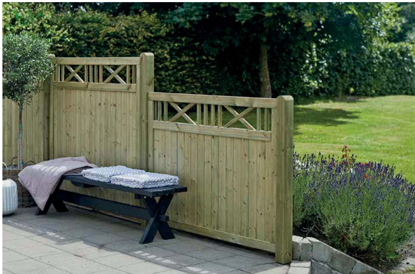
Kalmar-Elemente druckimprägniert S. 102 - mit Leimholzpfosten/Beschläge S. 111-112 und Nostalgie Bank schwarz S. 120