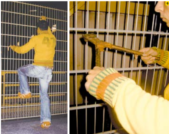
6. Sofortige Alarmauslösung bei Übersteig- und Durchdringungsversuchen