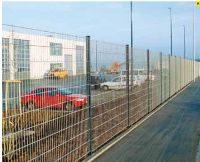
5. adronit®-Gitterzaun ECO I

Eine umfangreiche Farbpalette ermöglicht die harmonische Anpassung der Gitterzäune ECO I und III an das Gebäude und Grundstück. Dazu stehen Ihnen vier Standardfarben I (s.u.) ohne Aufpreis zur Verfügung. Weitere RAL-Farbtöne sind auf Wunsch gegen Aufpreis erhältlich.