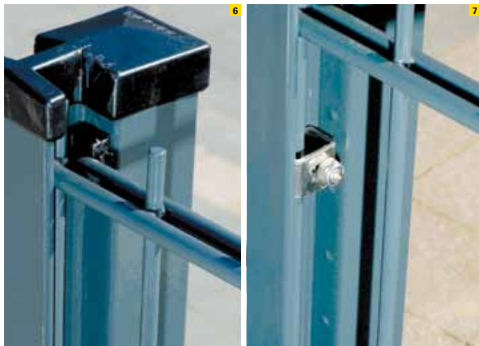
6. Detail: Befestigung des Gitters am Pfosten 7. Detail: Diebstahlschutz durch Sicherungs-U